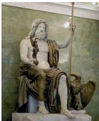
Зевс. Эски айкел.

Бара-бара дүйнөдө көптөгөн ар түрдүү диндер жаралат. Өздөрүнүн диндерин Египет, Индия, Греция, Рим ж.б. элдери тутунушкан. Бул диндер байыркы деп аталат. Мисалы “Байыркы Грек уламыштары” китебинен кудайлардын пантеону белгилүү.